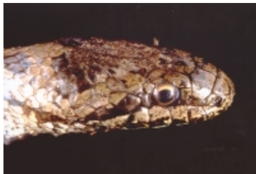
Fig. 1. Hodet hos slettsnok er lett avflatet og utvidet med karakteristiske platemønstre. Den har også en mørk platestripe gjennom øyet og bak i munnviken. Pupillen er rund hos slettsnok mens hoggorm har spalteformet pupill.

Ser man på utbredelseskartet hos Hardeng (1997), er det underlig at ingen har registrert arten fra kystkommunene Råde eller Rygge. En burde forvente arten i disse kommunene da den jo er kjent fra kommunene inntil. Jeg har vandret mye i naturen i Rygge, men aldri sett slettsnok der. Rygge er en intensivt drevet landbrukskommune