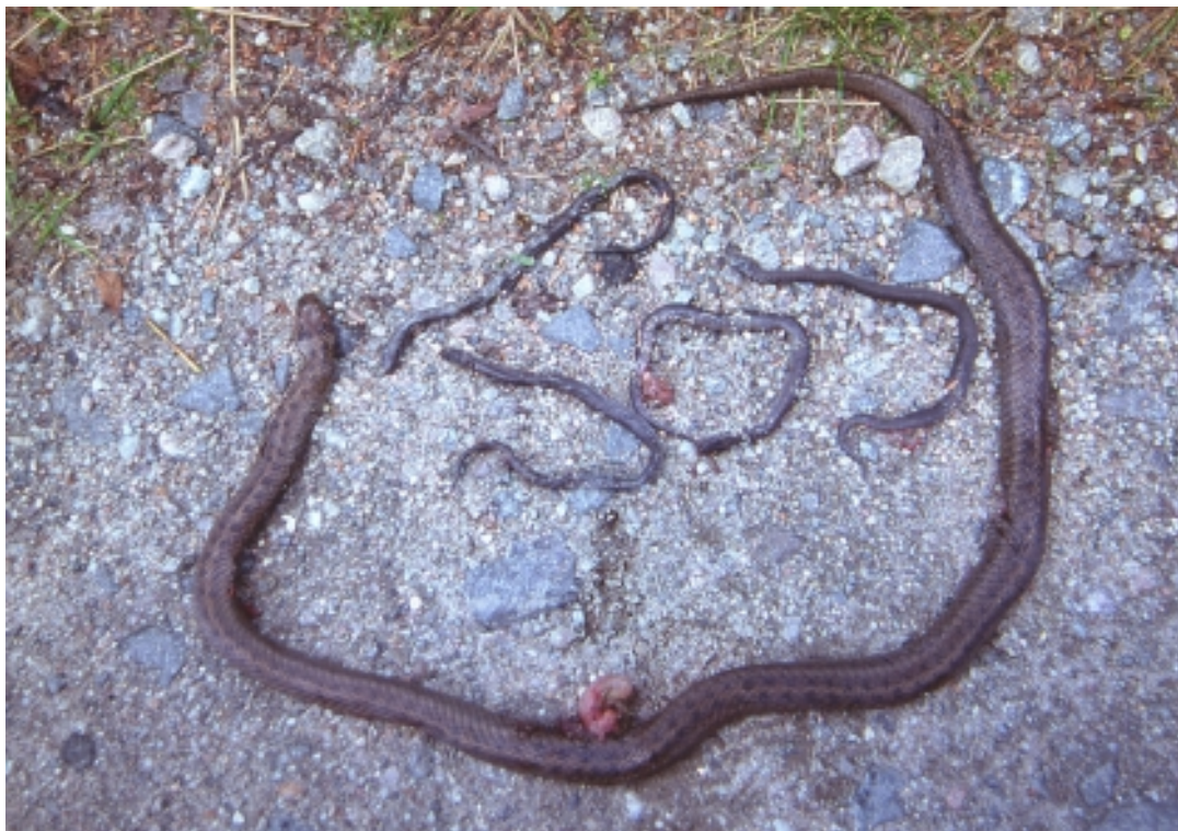
Fig. 2. Slettsnoken slik den ble funnet ihjelkjørt på veien i Jerndalen sør for Tomb. Fire av de seks ungene er lagt ved mora.

ingen så langt har påvist arten i Rygge som likevel burde kunne huse ett og annet eksemplar av arten. Det er kjent flere funn fra Vansjø-området, men altså ikke i sørkant hvor kommunene Råde og Rygge ligger. Like mangelfullt har det vært av registreringer i Råde som riktignok også er en intensivt drevet landbrukskommune, men her finnes mer kantkratt, skog og utmark enn i Rygge.