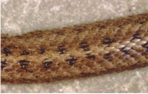
Fig. 3. Platene på ryggsiden hos slettsnok er typisk med sin avrundete, litt kantete form, og ofte med to markerte mørke flekker i enden på hvert skjell. Dyrets parvise mørke flekker i alternans langs ryggen er typisk hos slettsnok og holder den fra den mer fryktede hoggorm som er kjent for sitt siksak-mønster.

& Nilson 1991). Spikkeland & Bakke (1999) målte imidlertid en slettsnok nær Torgrimsbu i Marker til 92 cm, et mål som overgår alle tidligere angitte mål for slettsnok i Norge og Sverige. Rådesnokens seks barn målte fra 18,0-18,2 cm, og til sammen veide mor og seks barn 104 gram. Slettsnoken ble frosset ned og er tenkt skal inngå i de naturfaglige samlingene som spritpreparat ved Tomb Jordbruksskole.