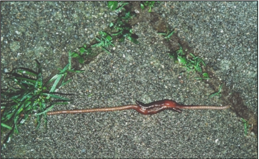
Fig. 2. Meitemark i paringsakt over betonghellene på en gårds plass i Rakkestad sentrum i juni 1999.