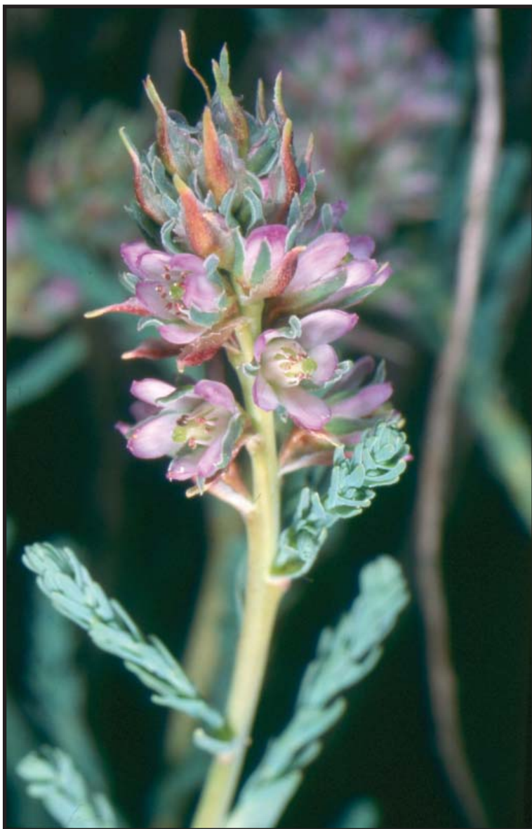
Blomstene hos klåved er vakkert rosa mens greinene er stive og strittende. Rota må være både kraftig og dyp for å feste en slik busk i ustabile sandmasser.