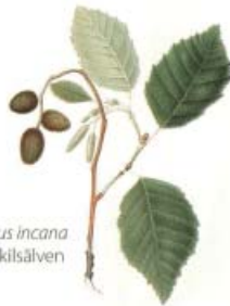
Gråal Alnus incana följer Örekilsälven söderut.