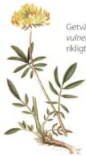
Getväppling Anthyllis vulneraria växer ofta rikligt på vägkanter.

Ungefär 5 km norr om Munkedal på vägen mot Hedekas tar man av mot Håby och följer sedan skyltning mot vattenverket. Det går att parkera vid sidan av vägen strax söder om vattenverket men tänk på att stora fordon måste kunna passera.