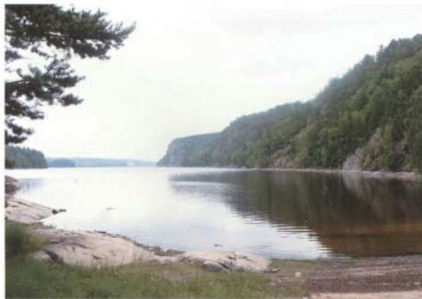
De branta klippstupen är karakteristiska för Kärn sjöns östra strand.