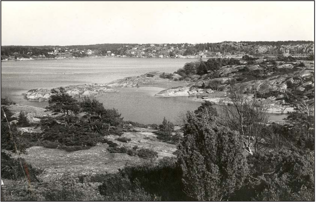
Fig. 2. Utsikt mot Gjetøya. Her vokser bl.a. kalkkarse Hornungia petraea . Foto: Øivind Johansen 1970-tallet.