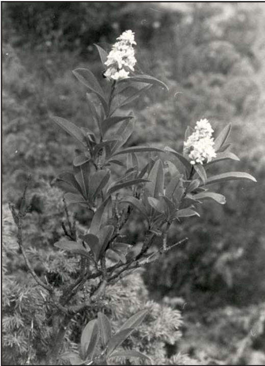
Fig. 4. Liguster Ligustrum vulgare . En rødlistet art som vokser både i Sørbygda og Vestbygda.