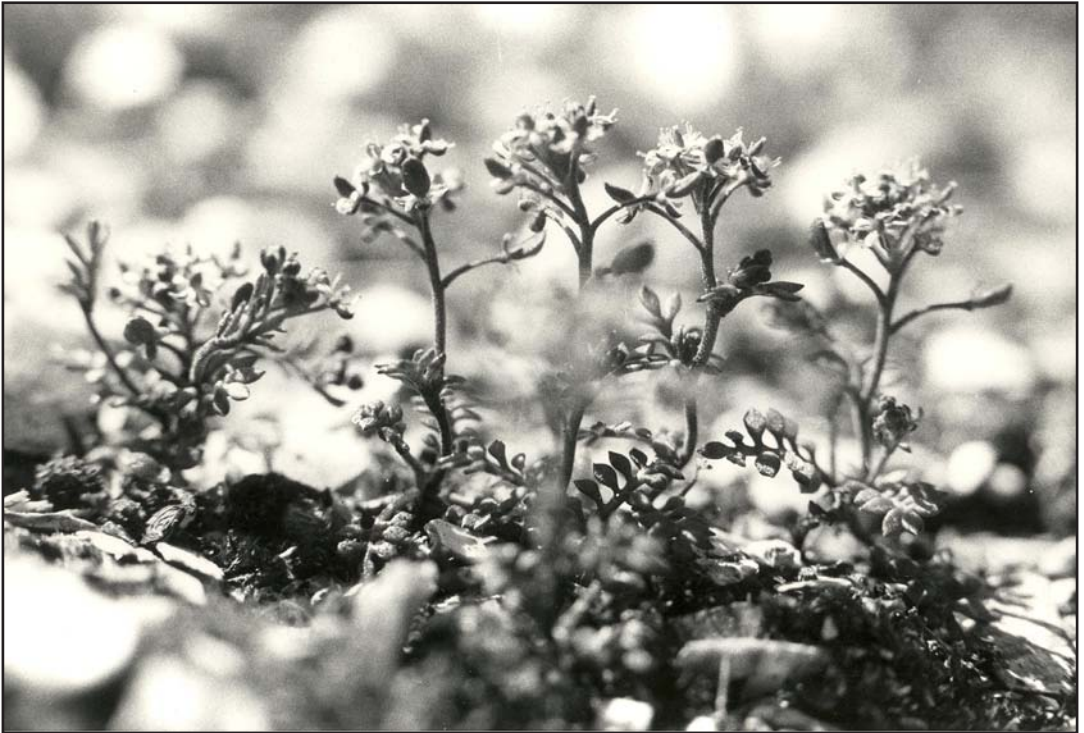
Fig. 3. Kalkkarse Hornungia petraea . En sjelden art i Sørbygda. I Norge finnes den bare på Hvaler og i Onsøy.

Medicago sativa ssp. sativa (Blålusern) Ny! Ved Foten 1958.